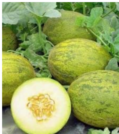
La hipersensibilidad al melón es la segunda causa de alergia en España.

Los científicos han desarrollado un mutante de la profilina, proteína responsable de la alergia al melón, capaz de estimular el sistema inmune para que evolucione hacia una respuesta no alérgica.