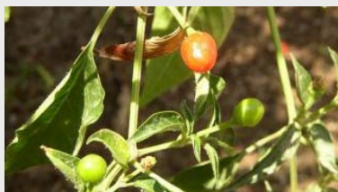
Pimiento silvestre o chiltepin ( Capsicum annuum var. glabrusculum )

El primer paso para analizar todas estas teorías fue seleccionar el vegetal con el que se iba a realizar este trabajo, un factor muy importante por la dificultad para obtener datos de una misma especie huésped en ecosistemas silvestres y agrícolas.